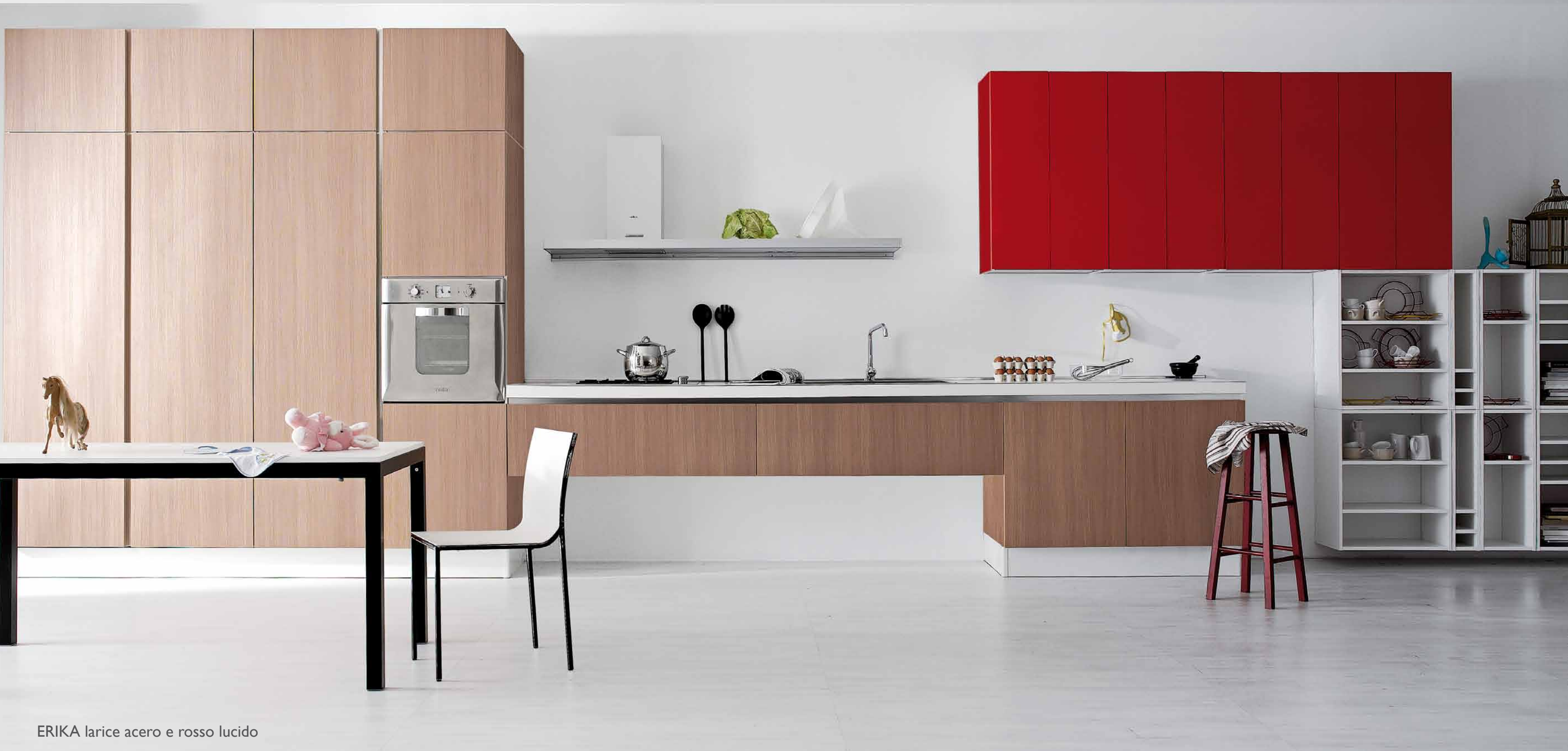
ERIKA larice acero e rosso lucido