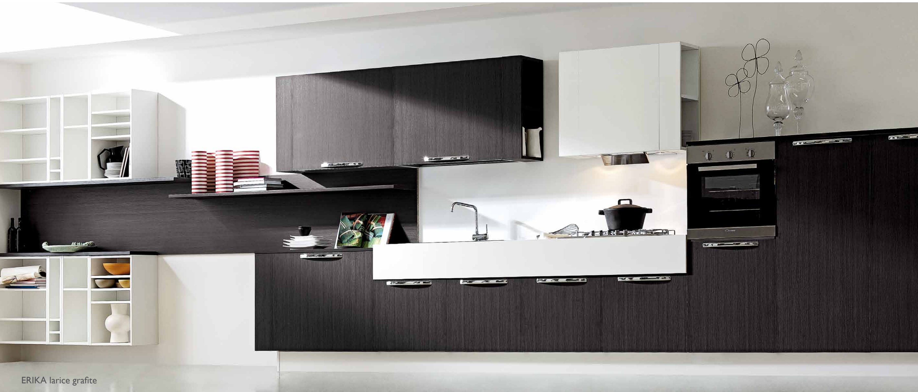
ERIKA larice grafite