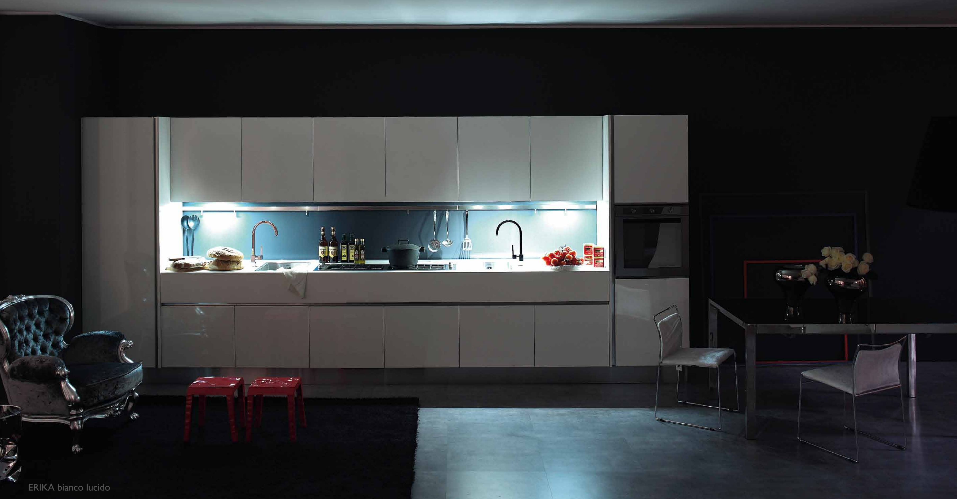
ERIKA bianco lucido