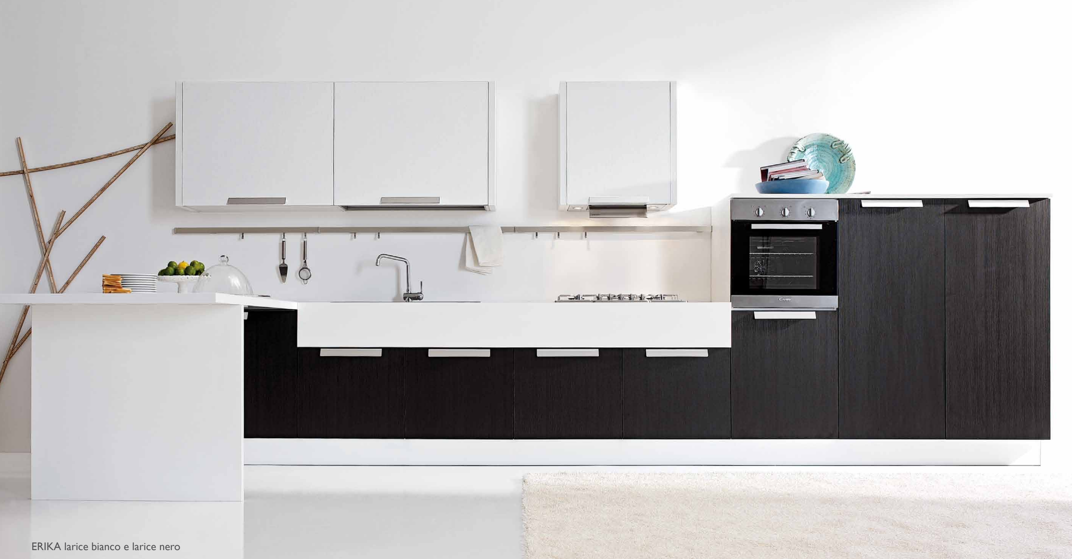
ERIKA larice bianco e larice nero