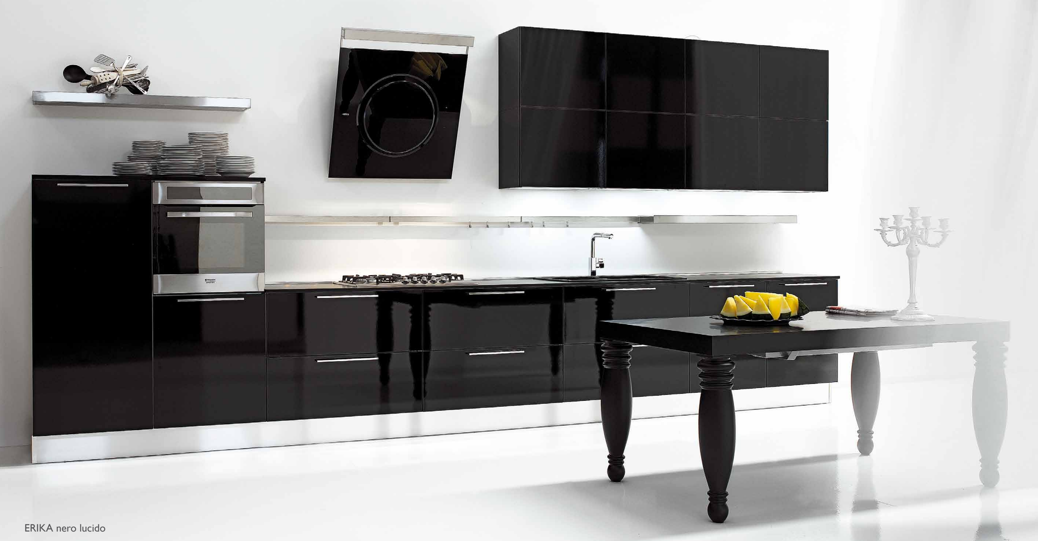
ERIKA nero lucido