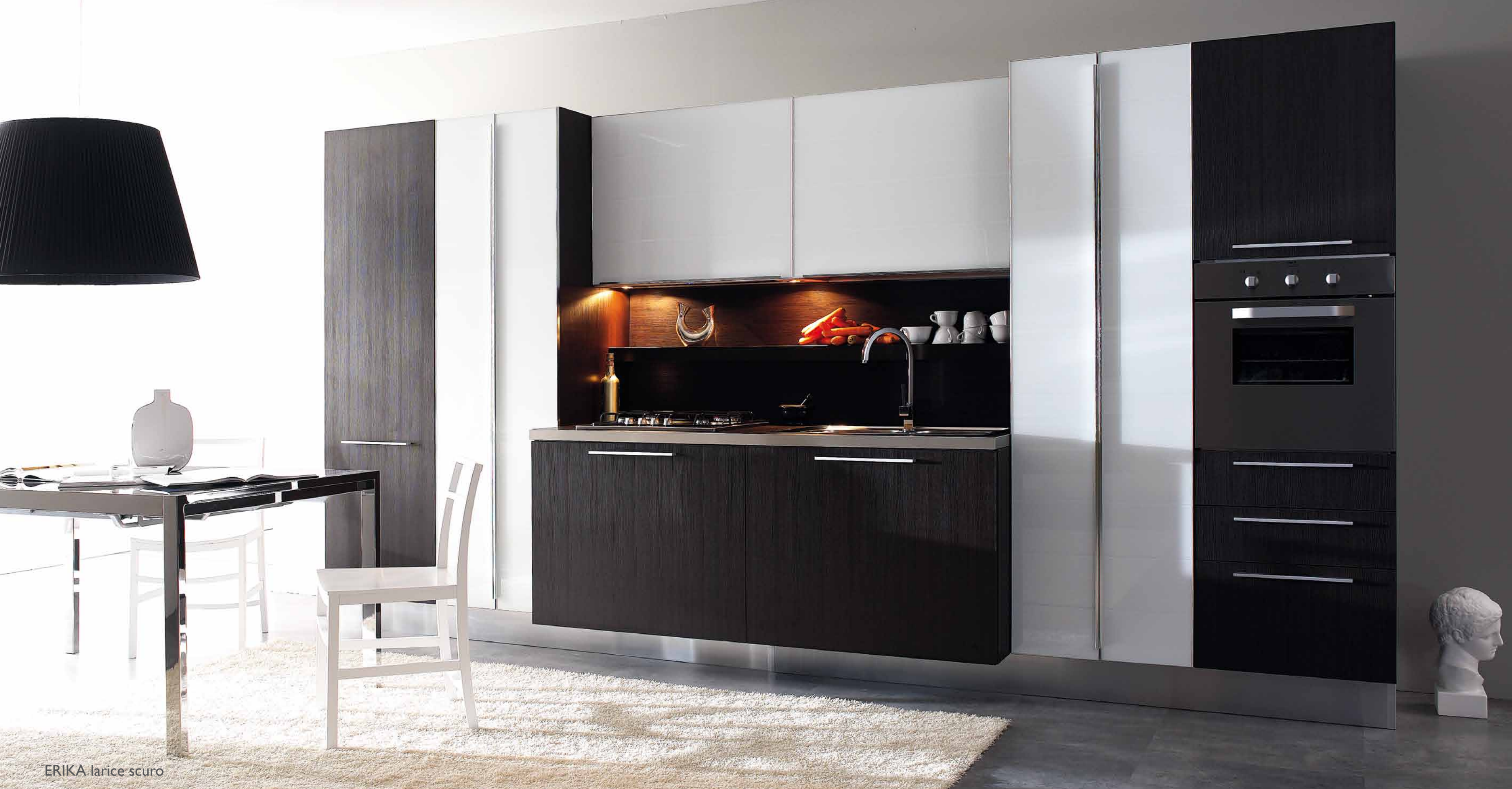
ERIKA larice scuro